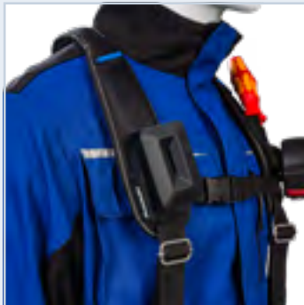
Geïntegreerde riemlussen op de borst maken optionele bevestiging van ProClick houders mogelijk. Boven de schouderriem kunnen ook ProClick zakken worden toegevoegd.