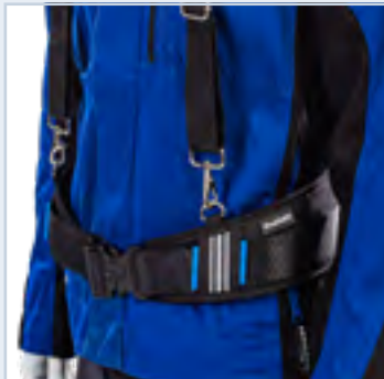
Bevestiging aan de ProClick riem met D-ringen.