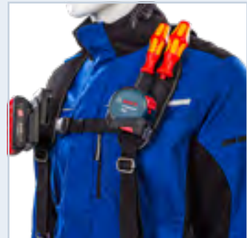
De zakken bieden extra opbergmogelijkheden voor kleiner gereedschap zoals schroevendraaiers of pennen.